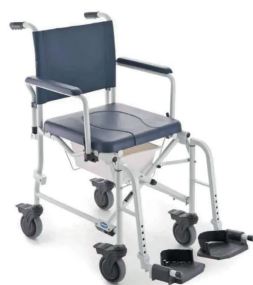
Fauteuil de douche