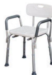
Chaise de douche